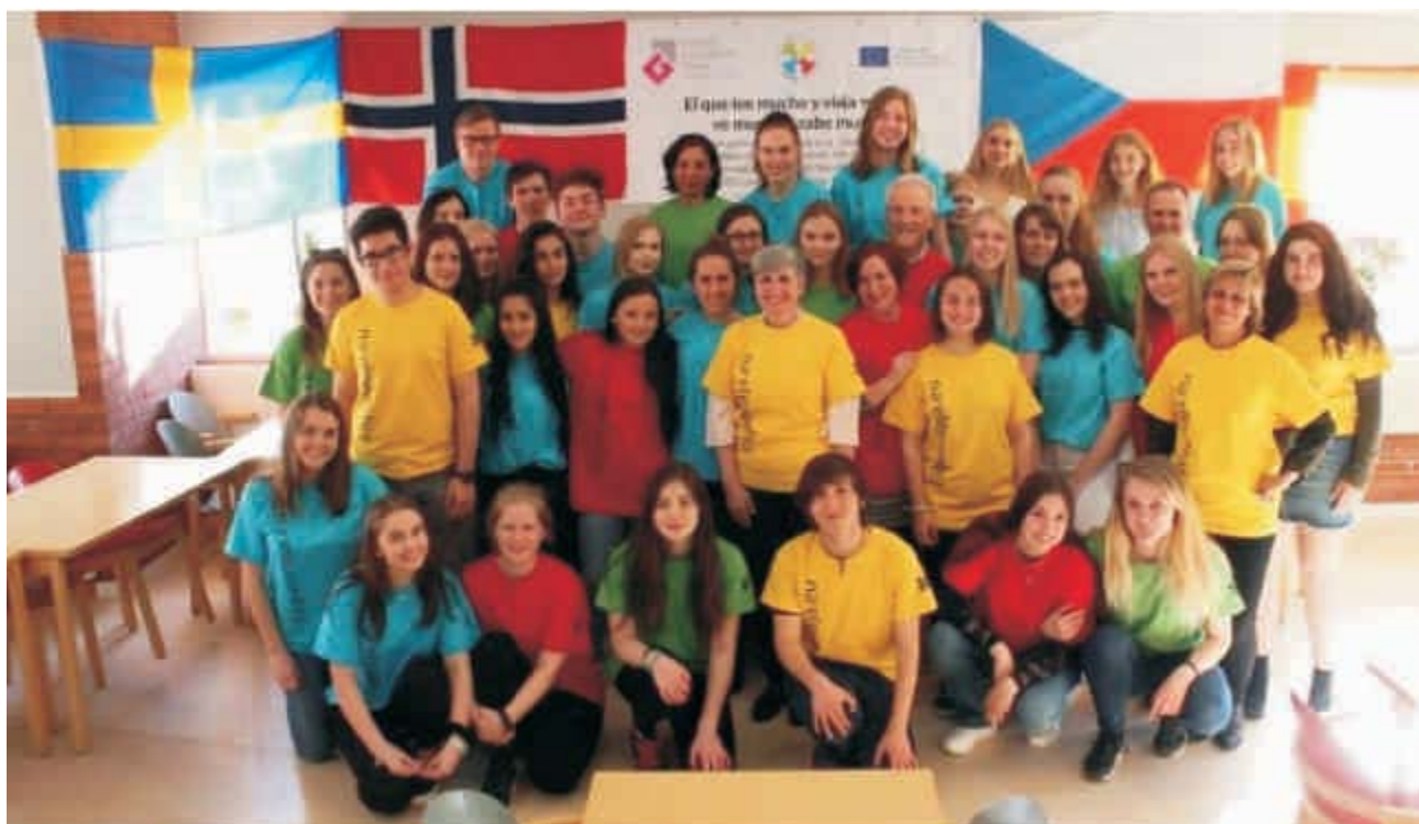
Mobilita Erasmu+ ve Švédsku

Škola pokračuje v realizaci svého vlastního projektu EMISE , kterým chce přispět ke zlepšení ovzduší ve své oblasti. Pro jeho realizaci měla ve školním roce k dispozici dotaci ze Státního fondu životního prostředí ve výši Kč 1.511.873,-, dotaci zřizovatele na spolufinancování projektu ve výši Kč 266.000,-, dotaci Magistrátu města Opavy ve výši 50.000,- Kč na spolufinancování projektu.