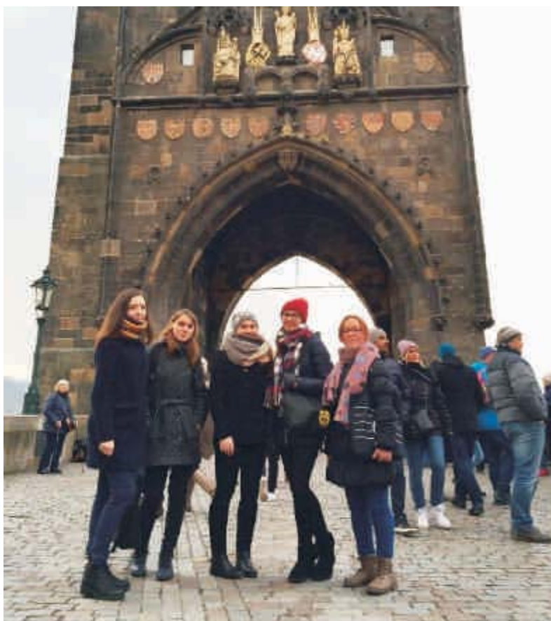
DofE - slavnostní předávání ocenění

1. 12. 2017 bylo 10 úspěšných účastníků programu odměněno v Praze při tzv. „Bronzové ceremonii“. Ostatní program dokončili během ledna, popř. června 2018.