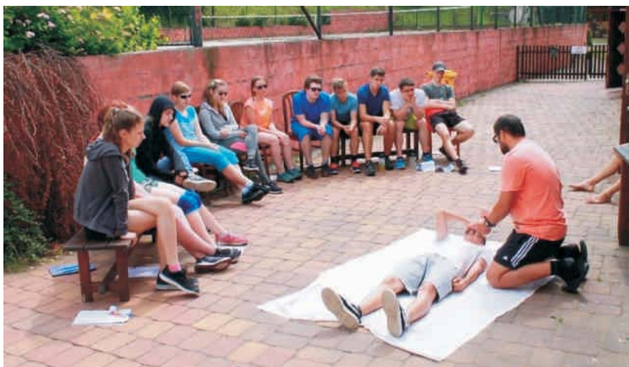
Letní ozdravný pobyt