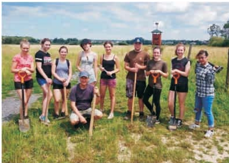
Pomáháme významné ptačí lokalitě

V loňském školním roce byla navázána úzká spolupráce také s Právnickou fakultou Univerzity Palackého v Olomouci. Ředitelka Slezského gymnázia a děkanka fakulty podepsaly historicky první smlouvu o vzájemné spolupráci a Slezské gymnázium je tak fakultní školou PF UP. Fakulta s gymnáziem v Opavě spolupracuje již delší dobu, a to na projektu Emise zaměřeném na životní prostředí, v rámci předmětu Street law, kdy vysokoškoláci učí gymnazisty základům práva, nebo prostřednictvím středoškolské soutěže v simulovaném soudním jednání.