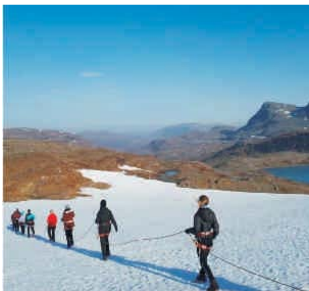
Žáci SGO zdraví z Norska

S ohledem na požadavky doby je samozřejmě pozornost věnována také výuce cizích jazyků. Škola v rámci rozvoje jazykových znalostí žáků neustále rozšiřuje servis nabízených služeb v této oblasti. Pravidelně se pořizují cizojazyčné materiály určené k zapůjčování zájemcům, v nabídce volitelných předmětů je např. seminář přípravy pro certifikát FCE, seminář anglické translologie či seminář z historie v angličtině. Organizovány jsou také kurzy v Slezském vzdělávacím centru, pedagogové nabízejí osobní konzultace, organizují pre-testy včetně centrálního přihlašování a platby až po realizaci testů. V rámci projektu Edison odučilo 5 stážistů celkem 90 vyučovacích hodin. Samozřejmostí je také působení rodilé mluvčí, která vyučuje celkem v 8 skupinách anglického jazyka. Rovněž francouzština a španělština je posílena o hodiny s rodilými mluvčími, čímž získávají žáci možnost přijít do kontaktu s aktivním jazykem v jeho přirozené podobě.