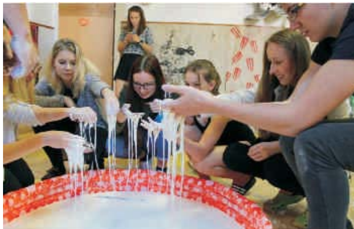
Den přírodních věd pohledem jedné čočky