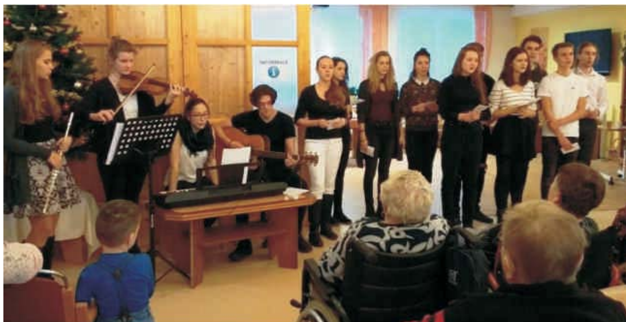
Zpívali jsme seniorům

Potravinová sbírka proběhla na Slezském gymnáziu v termínu 23. až 28. 4. 2018. Smyslem sbírky je shromáždit trvanlivé potraviny různého druhu, jež jsou určeny pro rodiče s dětmi, kteří žijí v azylových domech, pro osoby bez přístřeší apod. Sbírka je pořádána ve spolupráci s Potravinovou bankou Ostrava, z. s.