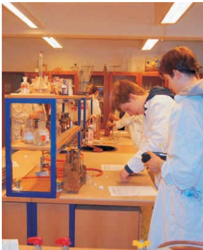
Emise - kroužek chemie

Konference se dotýkala témat „doprava a ovzduší“ a „světlo a ovzduší“ a měla záštitu nejen na úrovni Statutárního města Opavy, ale i Moravskoslezského kraje. Cestu do Opavy vážila i europoslankyně Kateřina Konečná a náměstek ministra životního prostředí Vladimír Mana. Bloky přednášek o Zdravém městě Opavě, ekologické dopravě v Opavě, aktivitách Moravskoslezského kraje v oblasti ochrany ovzduší nebo o světelném znečištění zpestřila vystoupení Smokemana o tajemství energie a žáků Slezského gymnázia, kteří prezentovali nejrůznější zajímavé fyzikálně-chemické experimenty související s emisemi. Součástí prvního dne konference bylo také předávání ocenění vítězům badatelských projektů, soutěž s projektem EMISE prostřednictvím chytrých telefonů o věcné ceny a večerní program, jehož součástí byla projekce dokumentárního filmu s diskusí na téma „světelný smog“ v prostorách Slezské univerzity v Opavě. Ve druhém dni konference také proběhla řada prezentací, jen s tím rozdílem, že se tentokrát za řečnický pult postavili samotní žáci – zástupci škol aktivně zapojených do projektu EMISE, kteří ostatním kolegům představili aktivity, jež v rámci EMISÍ realizovali ve své škole. Žáci a jejich pedagogové se tak mohli navzájem inspirovat, navázat spolupráci a sdílet své zkušenosti.