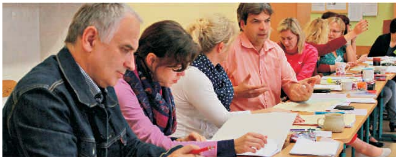
Vzdělávání pedagogů MBTI I