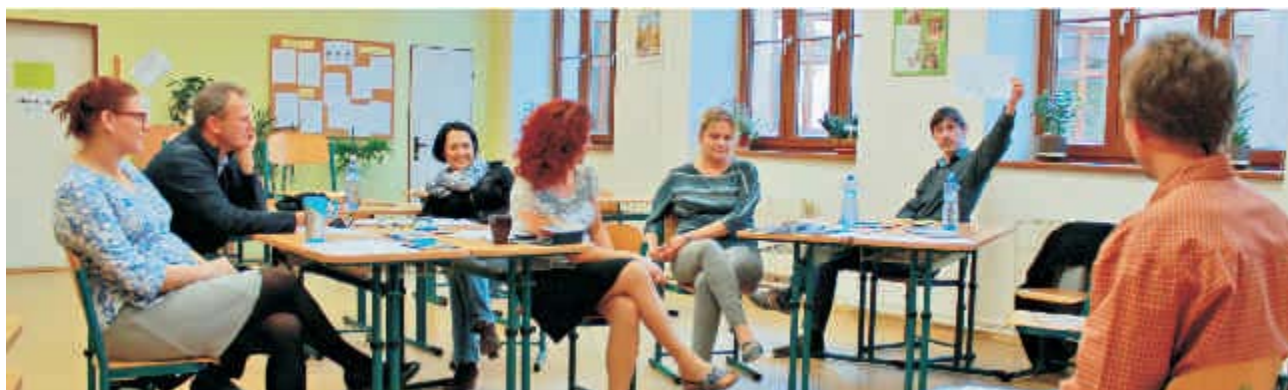
Vzdělávání pedagogů SPOPR