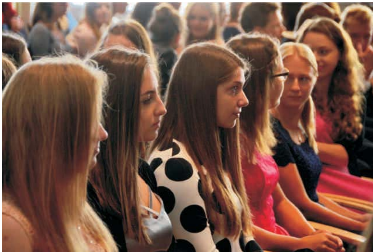
Zahájení školního roku

Spolupráce školy a Sdružení rodičů a přátel školy, z. s. , si klade za cíl pomoci při vytváření optimálních podmínek pro žáky, aby mohli úspěšně studovat. V souladu se svými stanovami se Sdružení podílelo na finančním oceňování žáků za vynikající studijní výsledky, za vzornou reprezentaci školy v oblasti kulturní i sportovní. Dále hradilo náklady spojené s účastí žáků na soutěžích, seminářích a exkurzích zvyšujících účinnost výchovně-vzdělávacího procesu a mnoho dalších aktivit, které si škola nemůže dovolit finančně zabezpečovat.