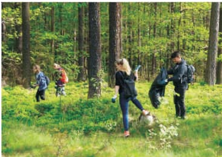
Den Země v lesích kolem Hlubočce

Studenti Slezského gymnázia jsou v rámci projektu Ekoškola systematicky vedeni k tomu, aby si vážili prostředí, ve kterém žijí, třídili odpad a rozumně využívali energie.