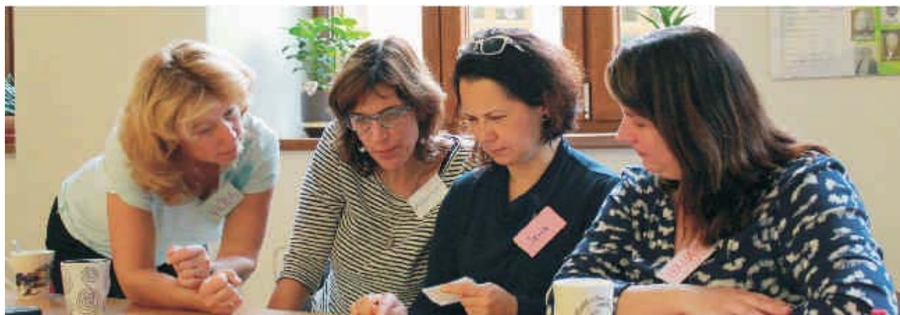
Vzdělávání pedagogů MBTII