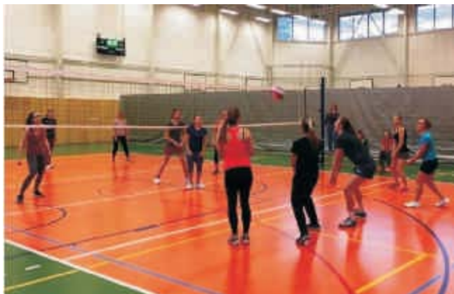
Vrchol volejbalového umění

Velkou předností je sportovní hala. K dispozici je nejen cvičební plocha o velikosti čtyř badmintonových hřišť, ale také gymnastický sál a malá posilovna. Hala je využívána nejen pro výuku a volnočasové aktivity žáků, ale také převážně v odpoledních a večerních hodinách různými složkami a sportovními oddíly Opavy. Její vybavenost nabízí možnost věnovat se jakémukoli sportu. Objekt bývá využíván i pro jiné než sportovní příležitosti, např. setkávání studentů na přednáškách a prezentacích..