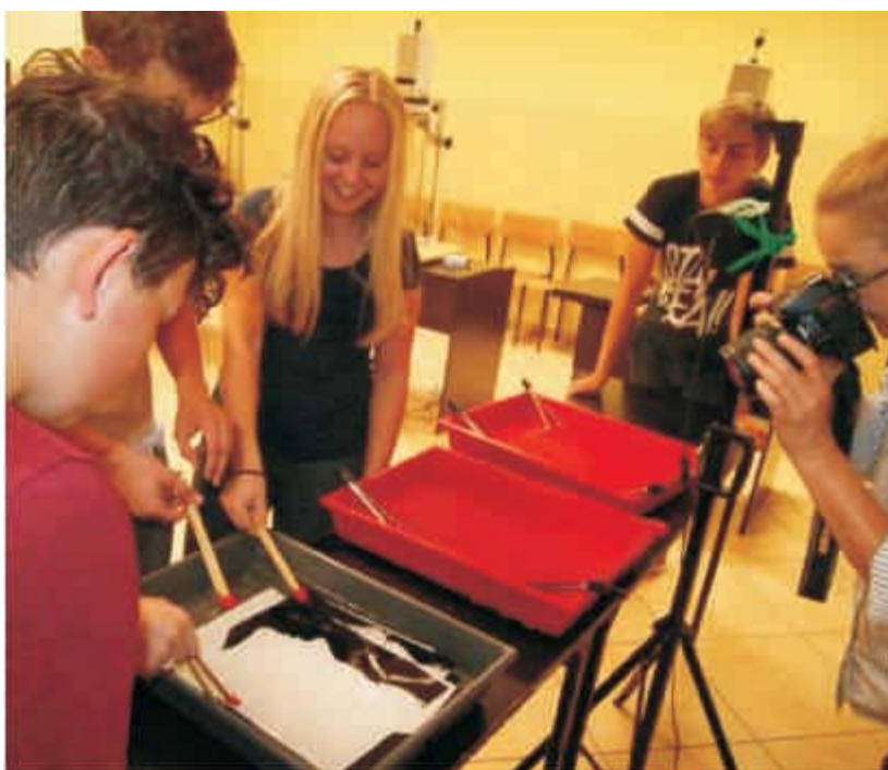
Lomography v Polsku

Projekt je realizován v rámci Euroregionu Silesia, Program INTERREG V-A Česká republika – Polsko; začátek projektu: 1. 3. 2018, ukončení projektu: 28. 2. 2019. Partnery projektu jsou Slezské gymnázium, Opava, příspěvková organizace a Zespół Szkół Ponadgimnazjalnych w Wodzisławiu Śląskim. V rámci projektu se vracíme zpět k analogové fotografii a jejímu původnímu zpracování v temné komoře. Zaměřujeme se na vyvolávání černobílých fotografií, které si studenti snadno zvládnou sami vyvolat v temné fotokomoře, které se naučí v rámci projektu. Seznamujeme se s principy lomografie, a prostřednictvím lomografie poznáváme památky, kulturu i sport. Projekt je zaměřen jak na teoretickou, tak i praktickou část. Stěžejním tématem je fotografie vytvořená fotoaparáty od Lomography, zaměření se na její výpovědní, tvůrčí a manipulační sílu. V teoretické části žák získává informace na workshopu v Praze z oblasti analogové fotografie, typech fotoaparátů, jejich rozdílech a funkcích. Učí se ovládat příslušenství fotoaparátů od Lomography. V praktické části uplatňuje získané zkušenosti, pracuje v praxi s odborníky, žák vytváří vlastní uměleckou fotografii pomocí získaných znalostí a experimentu. K získání komplexní zpětné vazby své nápady realizuje na společné výstavě. Těmito aktivitami