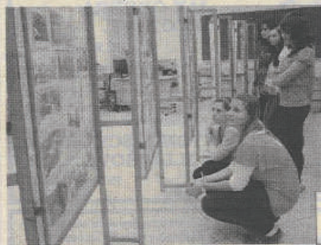
Slezské gymnázium zpřístupnilo široké veřejnosti výstavu věnovanou Velké vlastenecké válce.