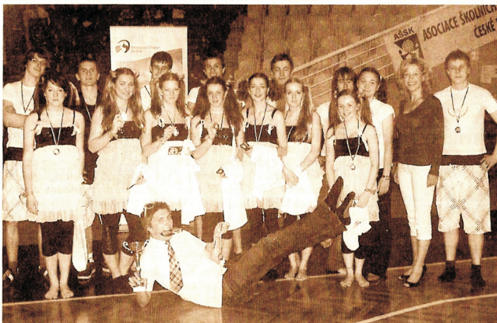
Slezské gymnázium v Opavě obsadilo v pohybových skladbách druhé místo.